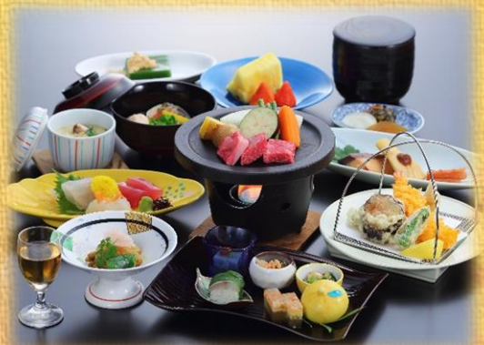
牛鉄板焼き会席 5,000円