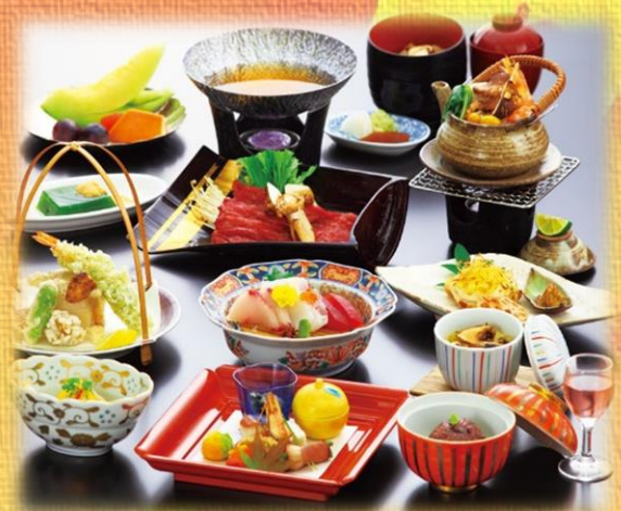
牛すき松茸会席 6,000円